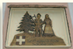
Saint-Laurent en Haute-Savoie