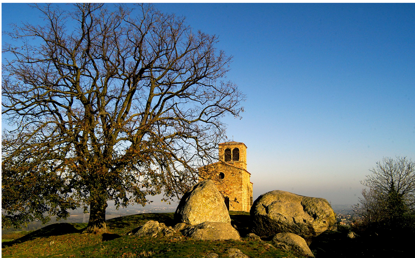
Chapelle romane de Saint Vincent (Saint-Laurent-d'Agnny)

Bulletin de liaison de l'Association Nationale des Saint-Laurent de France