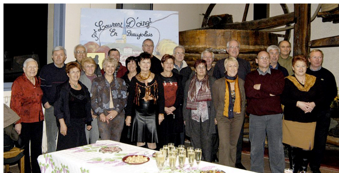
Accueil à Saint-Laurent-d'Oingt

N.B. : Descriptif du blason de Saint-Laurent-d'Agnay (ci-dessus) : Ecartelé