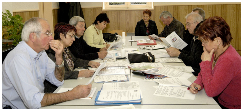
Le conseil d'administration en réunion