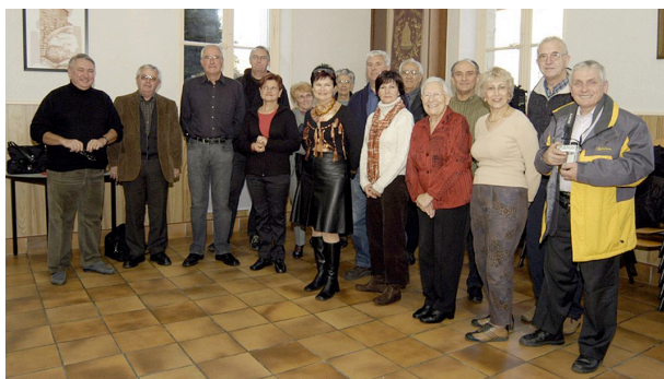
Accueil à Saint-Laurent-d'Agnay